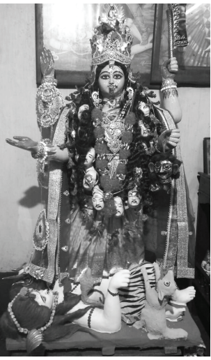
উত্তর কলকাতার নীলমণি মিত্র স্ট্রিট-এর এক পুরনো ঐতিহ্য মন্দির মন্দিরে পানামা মায়ের আরাধনা